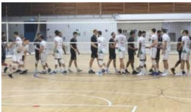
Il saluto delle squadre sotto rete